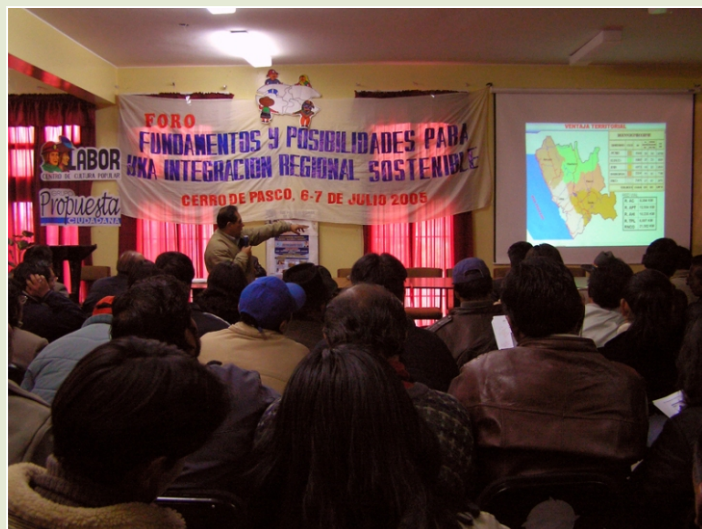
PARTICIPACIÓN. Estamos trabajando para construir las bases de una nueva democracia, donde la opinión de los ciudadanos sea escuchada.

Estos son claros reflejos de un sistema democrático que está apostando por la participación y buscando mecanismos para dejar de ser meramente representativo. Y esto es de suma importancia para el futuro del país. La democracia participativa nos ayudará a lograr mejores decisiones, legitimadas por procesos deliberativos e inclusivos, se evitará politizar las decisiones públicas, permitirá una mejora en la supervisión de la gestión pública, se optimizará el uso de los recursos públicos, se empoderará a la sociedad civil en su rol de actor fundamental en la toma de decisiones, se estrecharán las relaciones de colaboración entre autoridades y sociedad civil, habrá un manejo de conflictos más constructivo y se