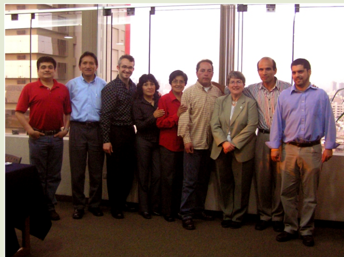
COOPERACIÓN. El proyecto es realizado gracias al apoyo financiero de ACDI y al trabajo conjunto de CECI, ProDiálogo, Labor, y el G. R. de Pasco.

Sin embargo, para lograrlo no basta la buena voluntad. Los