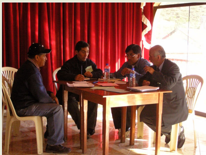
TODOS JUNTOS. El proyecto propicia el encuentro entre las autoridades y la sociedad civil y les propone trabajar unidos con objetivos comunes.

Este boletín quiere ser un vehículo para enfrentar estos retos como parte del componente comunicacional del proyec-