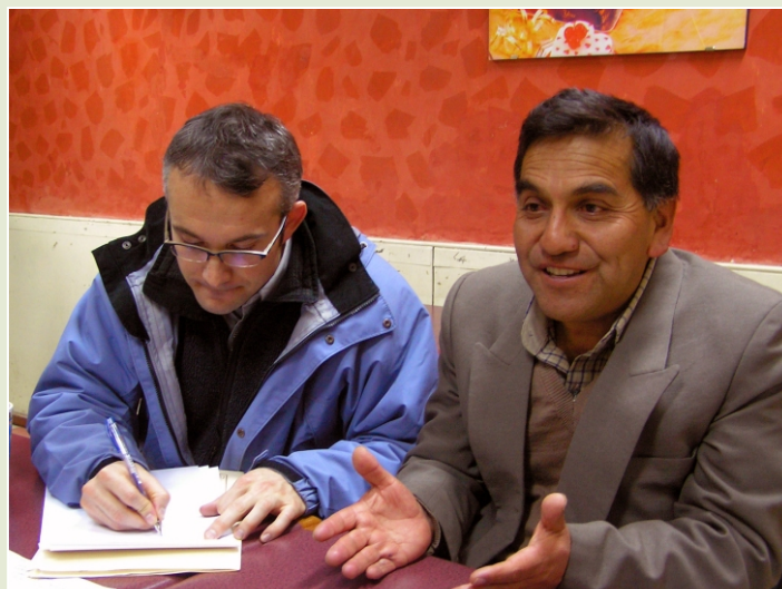
PANORAMA. La intervención se inició con una minuciosa investigación que determinaría la estrategia de intervención del proyecto.

tinto grado de consolidación: la Mesa de Concertación para la Lucha Contra la Pobreza (MCLCP) y el Consejo de Coordinación Regional (CCR), y se planteó la necesidad de crear un espacio que impulse un proceso de diálogo regional en torno a la Minería y el Desarrollo Sostenible.