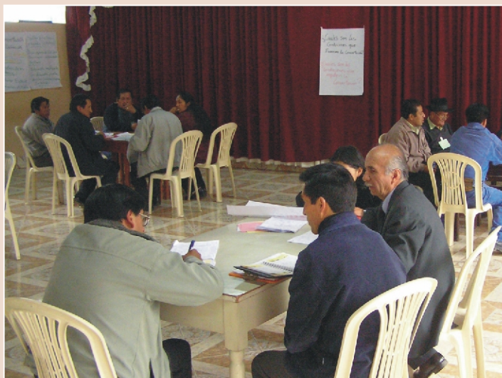
LÍDERES. El CCR se reúne continuamente y de manera descentralizada para facilitar la asistencia de los miembros de las localidades alejadas.

través de los cuales escuchar la voz de la población. En ese sentido, creemos que hay todavía una tarea pendiente con los ciudadanos, las autoridades y los representantes de la sociedad civil. Se hace necesario un mayor reconocimiento