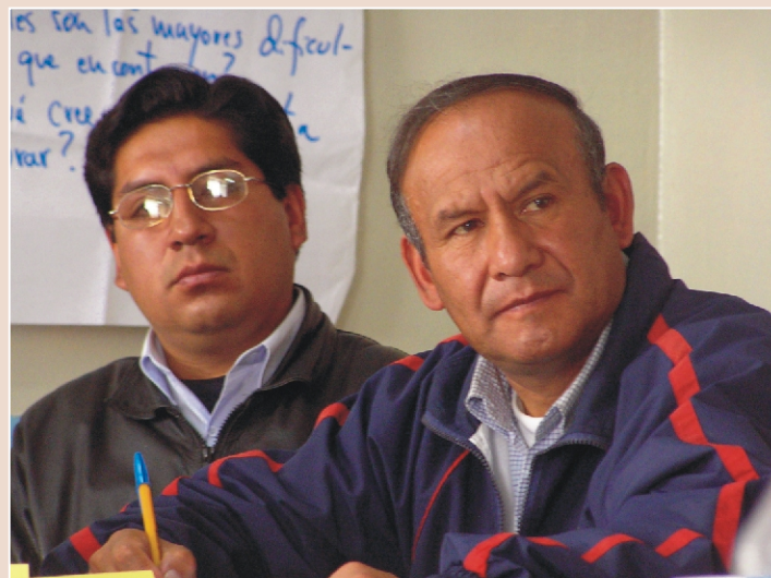
EMPUJE. El Grupo Impulsor viene trabajando para lograr las condiciones necesarias para la implementación del espacio de diálogo sobre minería.

En tal sentido, se decidió impulsar un proceso de sensibilización y capacitación con autoridades y con representantes de la sociedad civil que pudieran ser los actores de importancia en este proceso de diálogo, a través de un trabajo por separado. En enero y abril se realizaron talleres con ambos grupos, con el fin de