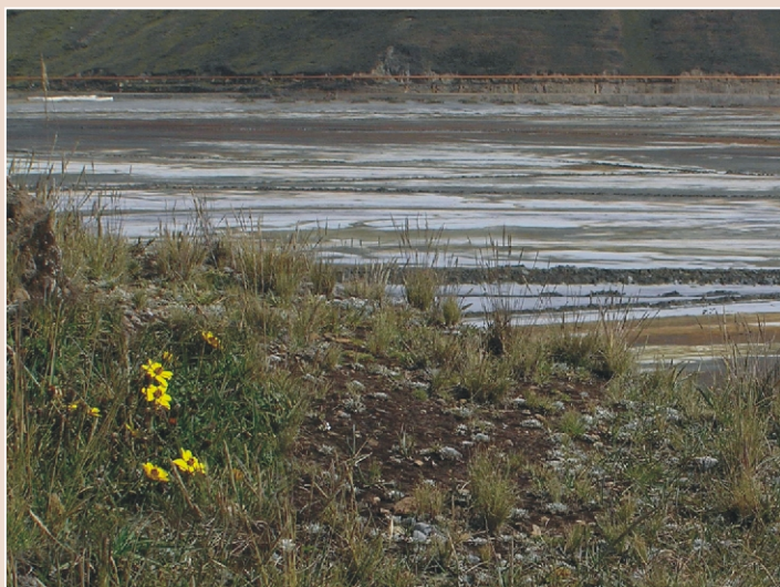
FLORES Y TEMBLORES. La vida trata de abrirse paso junto al relave. La ciudad de Pasco está apenas a unos kilómetros de esta locación.

Los actores directamente involucrados en la problemática