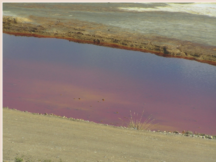
MAR ROJO. La actividad minera contamina las fuentes de agua en la región impidiendo que se realicen otras actividades productivas.

Percibimos que actualmente las poblaciones se sienten excluidas y ajenas al desarrollo económico que trae consigo la presencia de actividad minera en sus localidades, las autoridades locales no se encuentran debidamente capacitadas para enfrentar problemas de esta índole, y las empresas mineras no muestran el debido compromiso con el desarrollo sostenible y responsable de las localidades donde se encuentran instaladas. En esta situación, si las empresas mineras, autoridades y poblaciones plantean posiciones cerradas y antagónicas, poco se podrá lograr.