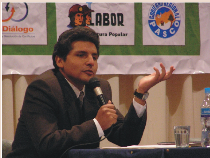
DERECHOS. Las instituciones se comprometieron a realizar una activa defensa de los derechos fundamentales de los ciudadanos de la región.

Para ello, se trabajaron temas relacionados al proceso de concertación y el rol del impulsador, convocante y facilitador en el mismo, se identificó a los actores que podrían ejercer estos roles y se especificó las acciones a seguir para impulsar este proceso. Del mismo modo, se afianzó el compromiso de las instituciones presentes para colaborar e impulsar el proceso de diálogo y concertación en la región, y se sugirieron algunos puntos que podrían ser considerados como parte de la agenda a trabajar en este espacio de concertación, tales como el impacto ambiental, la contaminación de recursos hídricos, el cumplimiento de PAMAS, regalías y canon, entre otros, y se plantearon proyectos productivos.