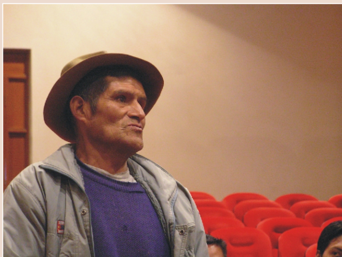
TRIBUNA. Los pobladores de diferentes comunidades tuvieron la oportunidad de plantear sus inquietudes respecto a esta problemática.

En esta reunión pudo observarse como logro importante la inserción de un discurso sobre manejo constructivo de conflictos en los participantes. Es un gran aporte para la Mesa, pues cuenta ahora con un equipo especializado en estos temas, capacitado a través de una metodología de aprendizaje por acción, que seguirá realizando estas labores de réplica con la población. 🌱