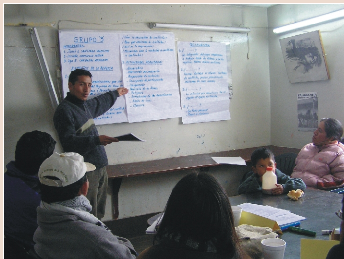
EMPODERADOS. Los facilitadores de la MCLCP brindan talleres en sus ámbitos y son convocados como mediadores en conflictos locales.

En la MCLCP, se promovió un programa de capacitación a fin de formar facilitadores locales con habilidades y herramientas profesionales en el manejo grupal, la resolución de conflictos y la pedagogía de enseñanza. Los facilitadores capacitados realizaron réplicas en sus ámbitos, y despertaron en la