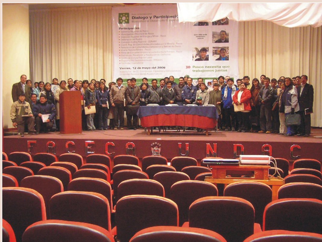
HAY FUTURO. Autoridades, instituciones del Estado, comunidades campesinas, organizaciones de base y la sociedad civil se hicieron presentes en el foro para compartir puntos de vista respecto a la problemática minera.

Expositores y panelistas subrayaron la necesidad de continuar impulsando los espacios de diálogo y participación en la región y a nivel nacional, para mejorar la calidad de vida de la población. También se destacó la importancia de la experiencia que la Vicaría Pastoral Minera tiene con las empresas mineras de la región.