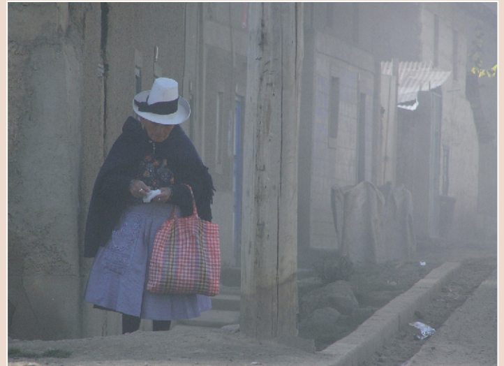
NUBE GRIS. La salud de los habitantes de las comunidades cercanas a los asentamientos mineros sería uno de los temas prioritarios de este espacio.

sensibilizarlos sobre los retos, límites y condiciones que requieren los procesos de diálogo, y concebir cuáles podrían ser los siguientes pasos a tomar para crear las condiciones en pro de un diálogo sólido sobre los temas citados.