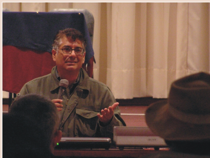
CONTACTO. Los ponentes invitados lograron capturar la atención de los participantes con exposiciones claras y un lenguaje sencillo y directo.